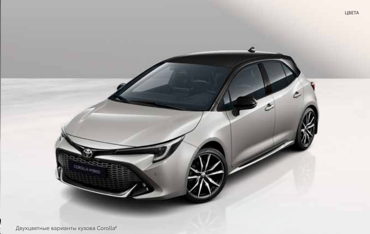
Двухцветные варианты кузова Corolla 9