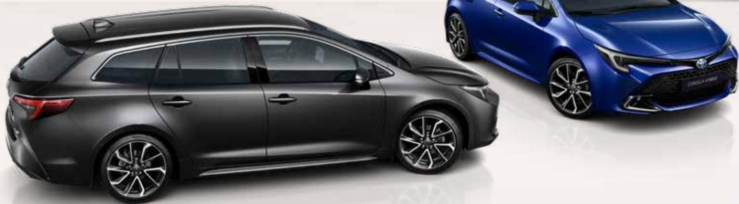
Цвета кузова Corolla**