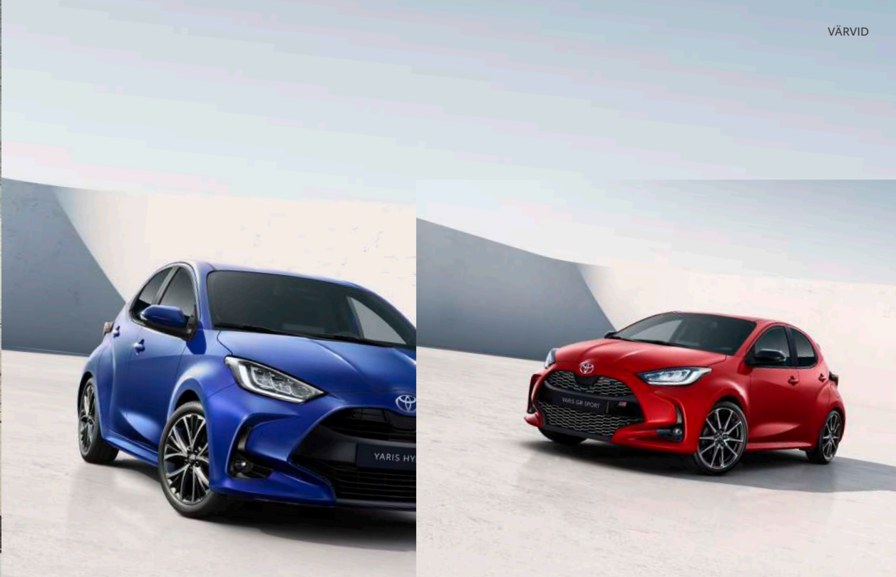
Yarise ühetoonilised värvivalikud