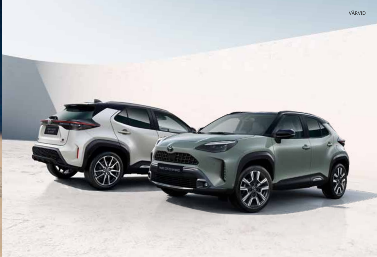
Yaris Crossi ühetoonilised värvivalikud