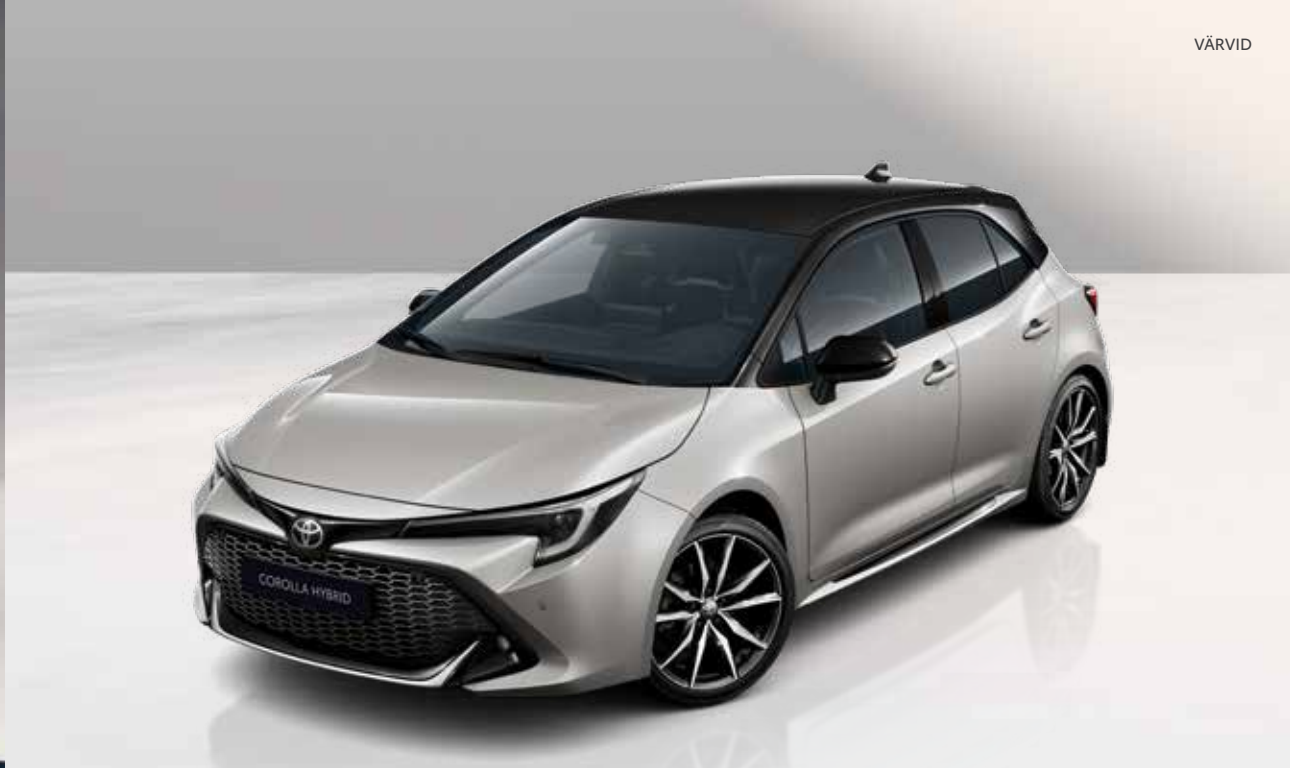
Corolla kahetoonilised värvivalikud 9